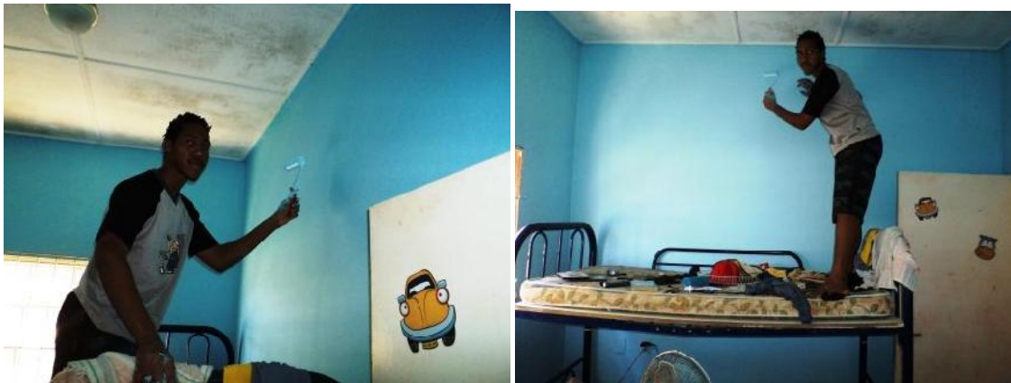
M. helpt ons als een echte "huisschilder" de slaapkamers te verven.