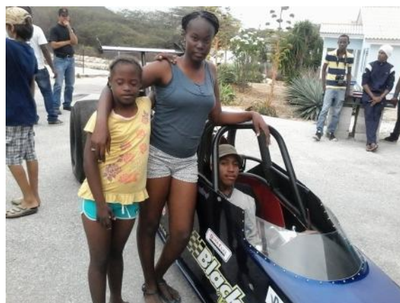
"KLEINE KINDEREN" WORDEN GROOT ! BEZOEKERS MET EEN "ECHTE" RACE AUTO