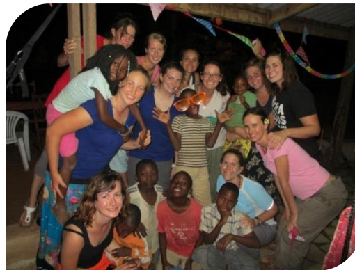
Mijn huisgenoten en kids van Iris Ministries.

En ik zou zeggen...maak je dromen waar! God geeft ze niet voor niets.